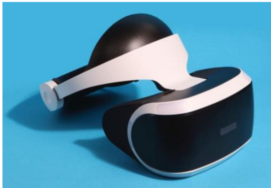
Casque de réalité virtuel

Application des Règles générales pour l'interprétation du Système harmonisé 1 (Note 3 du chapitre 95), 3 b) et 6. 710108.20.2016.3